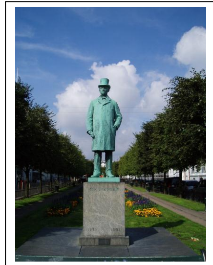
Carl Fiedrich Teitgen (1828 – 1901). Sa statue à Copenhague.

Il fonde en 1868, la Grande Société des Télégraphes du Nord - Det Store Nordiske Telegraf-Selskab – The Great Northern Telegraph Company dont le siège se situe au centre de Copenhague qui s'impose comme un premier concurrent sérieux de l'Eastern Telegraph britannique.